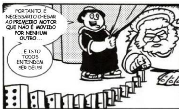
Figura 2: Fonte: Action Philosophers!

A ideia do argumento é, basicamente, dizer que o universo é como um jogo de dominó enfileirado. As peças não podem derrubar umas as outras sem que algo provoque o movimento. Assim, Deus é quem dá o primeiro “peteleco” para que o universo se mova.